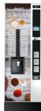
Canto 2 Becherwerke