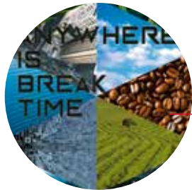
Anywhere is break time