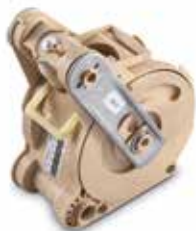
Ein patentierter Kaffeebrüher für einen perfekten Kaffee