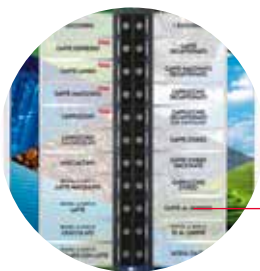
Ein breites Getränkemenü selbst für die anspruchvollsten Aufstellplätze